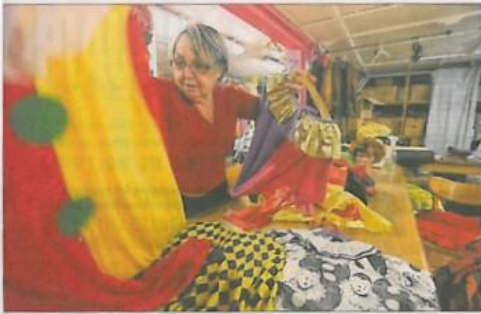
Cette année, le thème du carnaval est le cirque. Un sujet qui a grandement inspiré les couturières du carnaval.