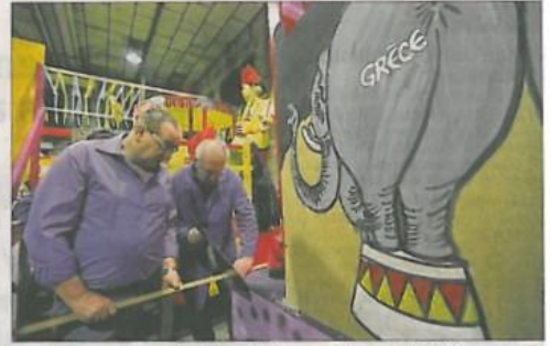
Les derniers ajustements (là les D'Ildappers Wagges de Zillisheim) seront réalisés d'ici vendredi, pour un char encore plus beau.