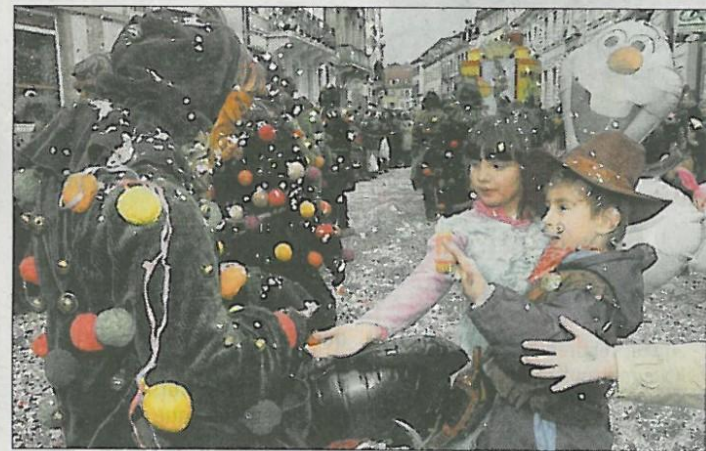
Des sorcières, des confettis et des enfants heureux.