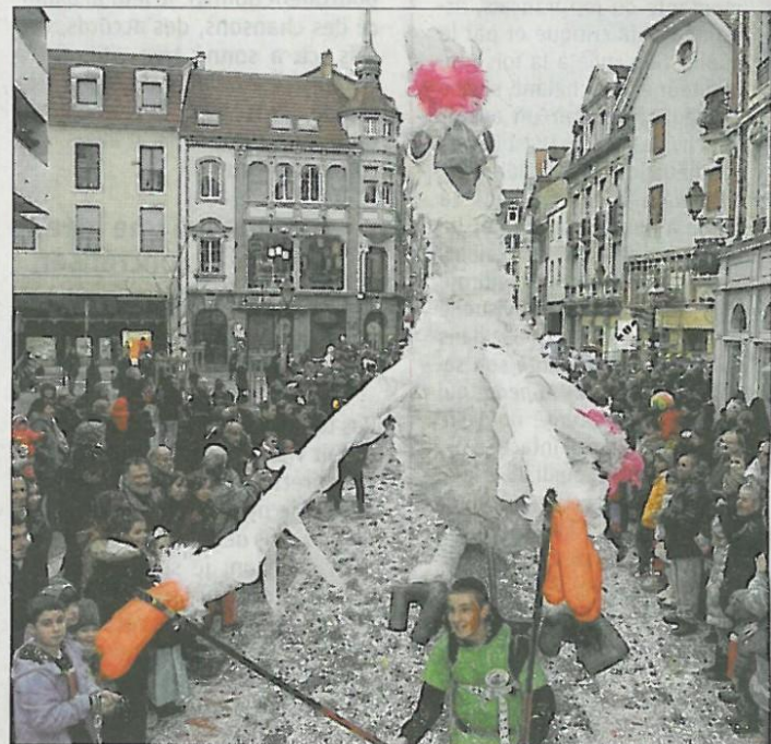
La troupe des Géants vits de Cherbourg a fait sensation cette année, avec ses grandes marionnettes.