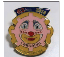
Le nouveau pin's sera indispensable.

SURFER Le programme complet sur le site du carnaval www.carnaval-mulhouse.fr