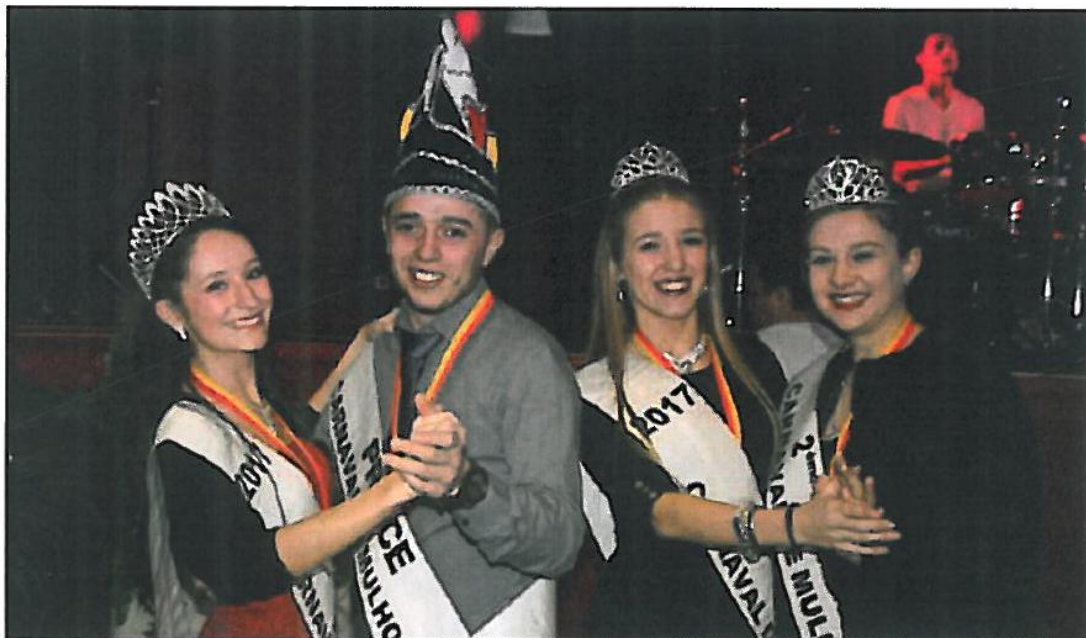
Le bal des débutant(e)s pour le couple princier et les premières dauphines du carnaval.

Voici les prochains rendez-vous du carnaval. Un stand d'infos, vente de pin's et gadgets se trouvera place des Victoires, samedi 25 février, de 9 h à 18 h, avec animations carnavalesques à partir de 13 h 30 en centre-ville et du dimanche 26 février au vendredi 3 mars, de 13 h à 18 h. Les premiers temps forts avant le week-end de carnaval seront l'élection du petit couple princier, mercredi 1 er mars, à partir de 10 h, à Cora Dornach avec jeux, maquillage, petit train, animations et, à 14 h 30, élection du petit couple princier. Du jeudi 2 au dimanche 5 mars, concours de fresques carnavalesques sur tissus pour les enfants de 4 à 12 ans, exposition sous chapiteau place de la Réunion proposée aux écoles maternelles et primaires mulhousiennes, aux périscolaires et aux centres sociaux culturels mulhousiens.