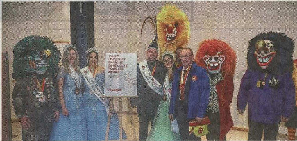
Les masques de Waggis sont fabriqués en résine, vendue par un spécialiste suisse. Chacun pèse un peu plus de 4 kg.

Mulhouse s'apprête à vibrer au rythme du carnaval avec la 73 e cavalcade internationale des fous, ce dimanche 22 février. Notre journal, partenaire de la manifestation, a organisé ce mardi 17 février une réception, marquant le début d'une semaine chargée pour l'association.