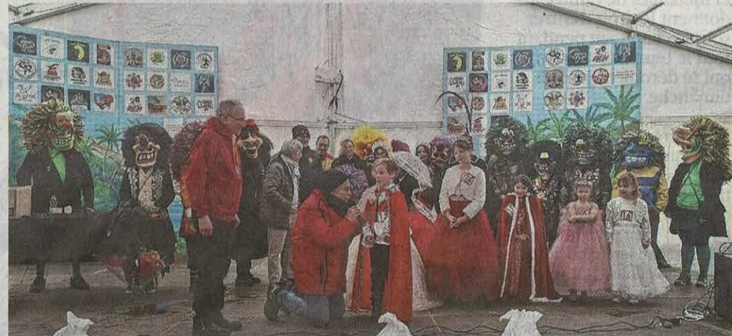
L'élection du petit couple princier, initialement prévue samedi dernier, s'est tenue ce mercredi après-midi.